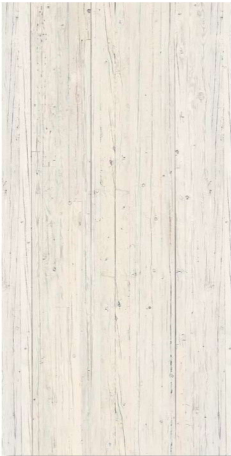
Altholz Creme *