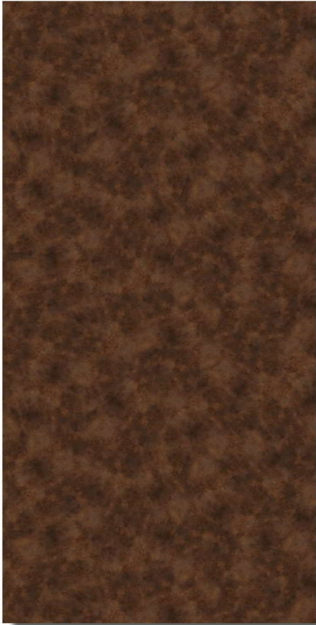
Rost dunkel **