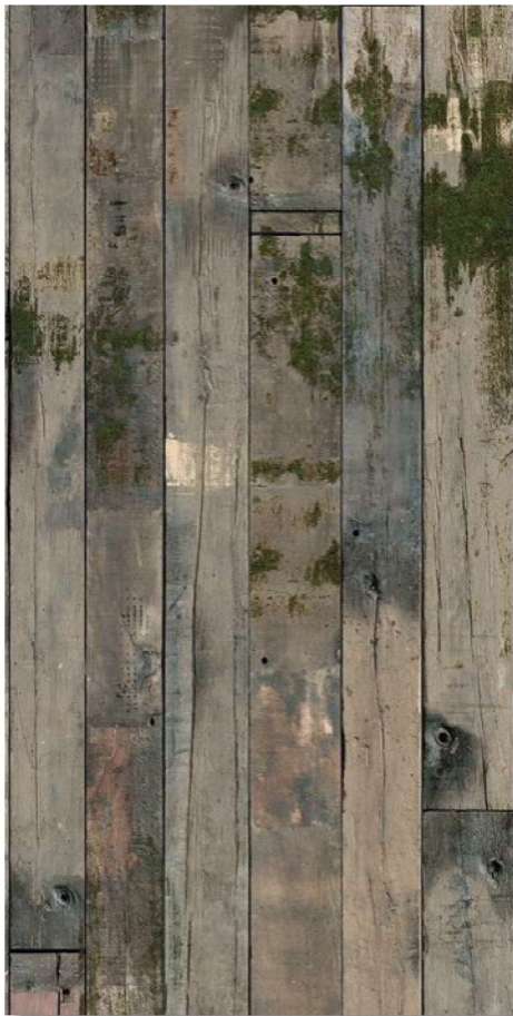
Eiche bemoost *