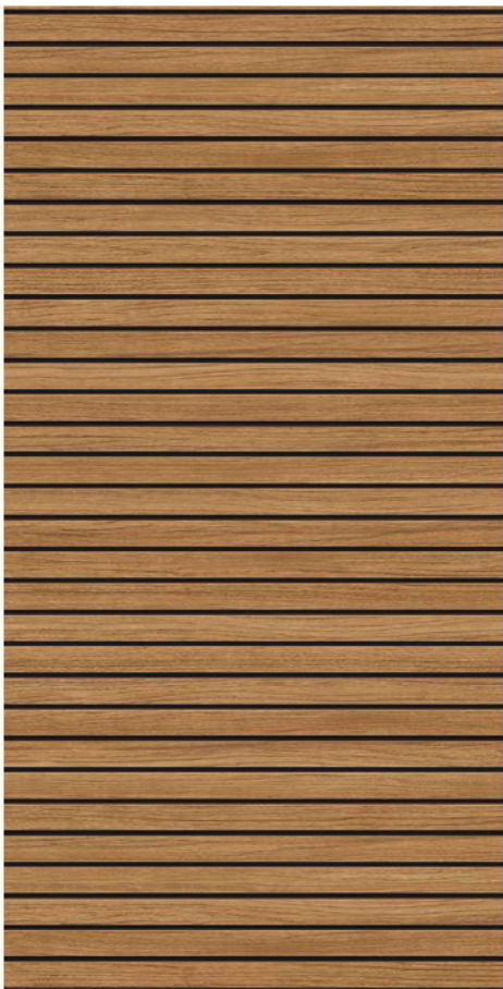
Holzlamelle ***/bzw. * bei Duplex 1000 x 3050

Titel Fotolia-KB3_96842625_+SchwarzwaldEiche+MetallOxidiert Wilkes-GuteLauneBalkon_+AltholzCreme AdobeStock_71347015_JSPhoto_+Dunkelgrau AdobeStock_358507454_+TravertinDunkelgrau+Ziegelbeige Wilkes-Sommerterrasse-Ecke_+Ziegel-Beige AdobeStock_70194408_KB3_+Bruchstein-Mittelgrau Wilkes-Terrassenbrüstung_+Wallis shutterstock_458380297_+Travertin Shutterstock_6859253226_+Holzlamelle