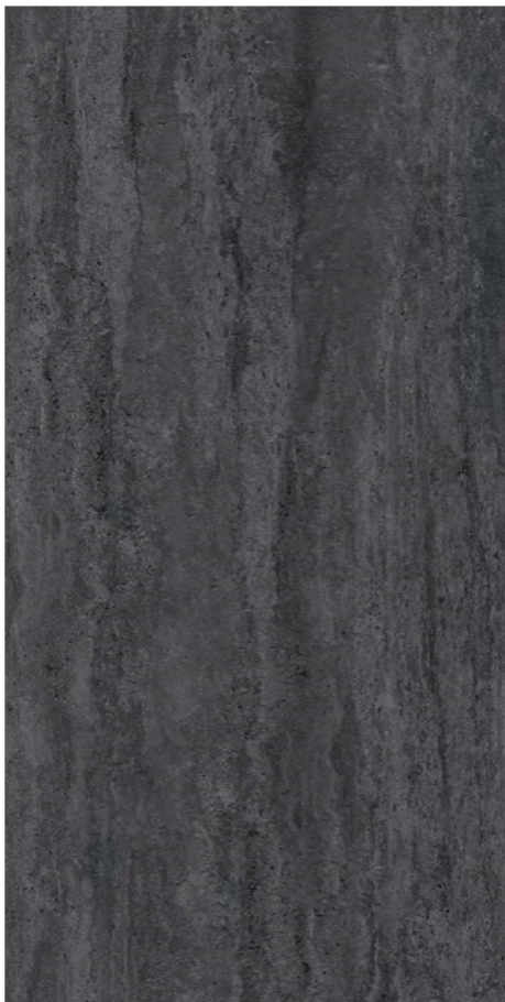
Travertin Dunkelgrau *