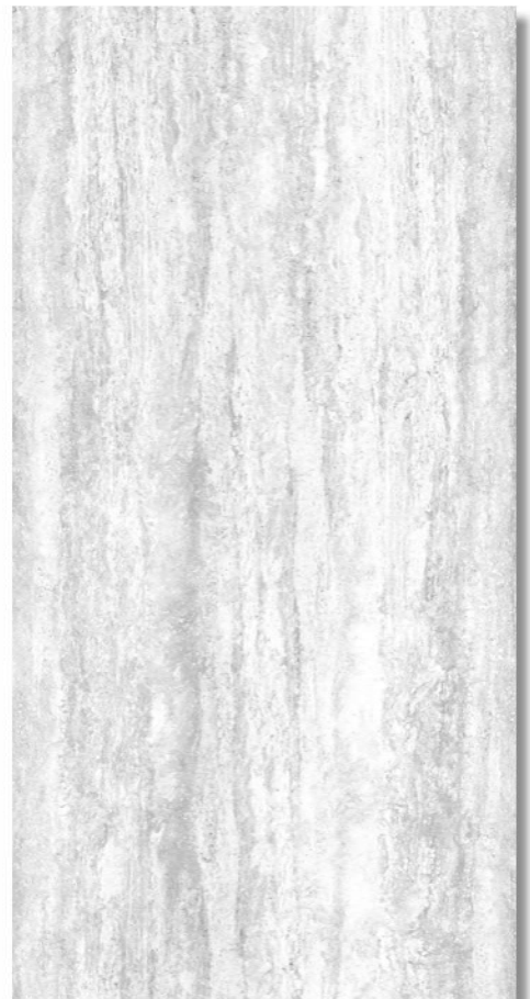
Travertin Weiß *