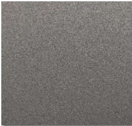
Unifarbe Dunkelgrau metallic **