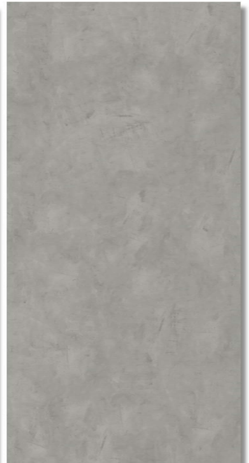
Beton metallic **