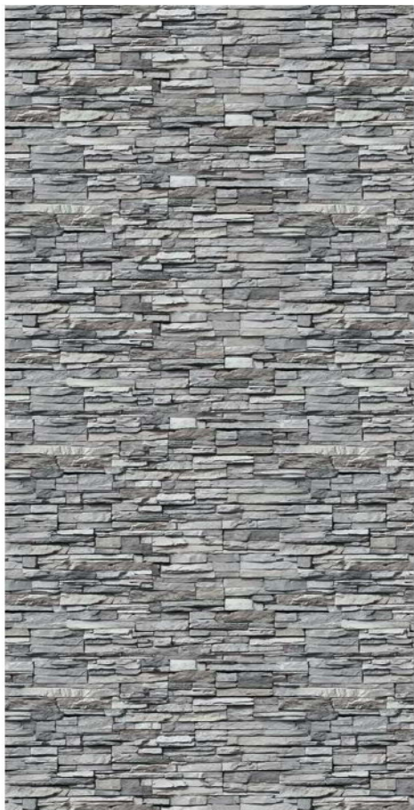
Bruchstein Mittelgrau ***