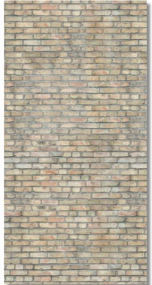
Ziegel Beige ***