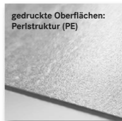
gedruckte Oberflächen: Perlstruktur (PE)