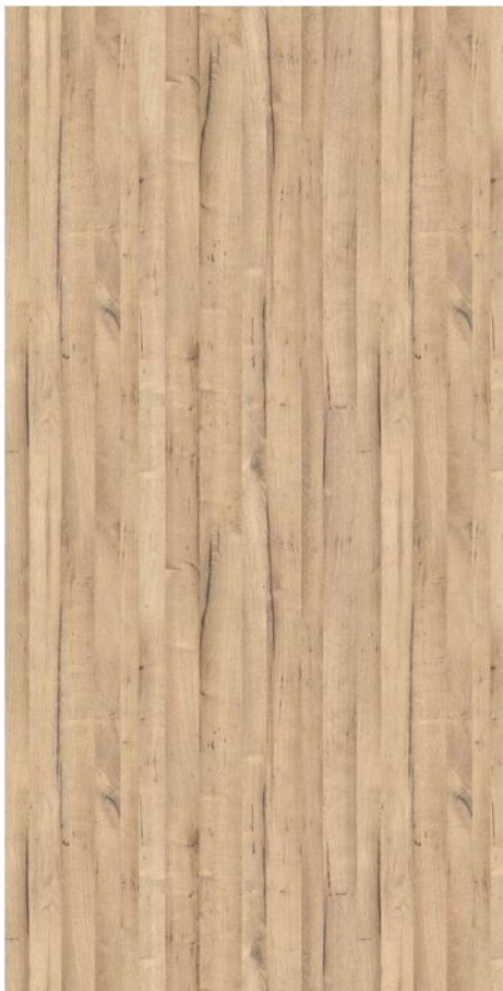
Schwarzwald Eiche hell *