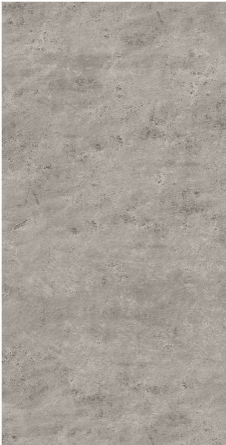
Stein Grau *