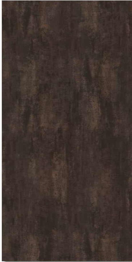
Metall oxidiert *